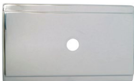
TAPA DE FIBROCEMENTO FRANKLIN 13,3 x 22 cm.