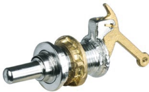
BOTON LARGO DE BRONCE CROMO